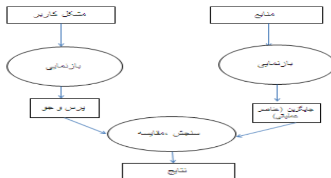
تصویر ۳. دیدگاه سنتی از روند بازیابی اطلاعات

ارزیابی عملکرد بازیابی اطلاعات علمی مبتنی بر نتایج یافته‌ها معمولاً به شکل کمی صورت می‌گیرد؛ بنابراین ارزیابی سنتی از قضاوت مبتنی بر مقایسه نتایج فراگیر در مقابل معیار عملکردی مشخص شده تشکیل می‌شود. شرایط واقعی اغلب غیرقطعی و نامعلوم هستند و نمی‌توان آن‌ها را کاملاً دقیق توصیف کرد. دیدگاه سنتی ارزیابی عملکرد با هدف ارزیابی، قضاوت و یادآوری عملکرد است (تصویر ۳)؛ در حالی که در دیدگاه مدرن، فلسفه ارزیابی بر رشد، توسعه و بهبود ظرفیت ارزیابی‌شونده متمرکز شده است (۲۱). در این راستا ارزیابی کمی دچار نقص‌هایی بوده و قادر به ارائه نتایج واقعی نیست.